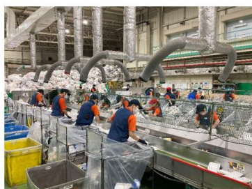
リサイクルの様子